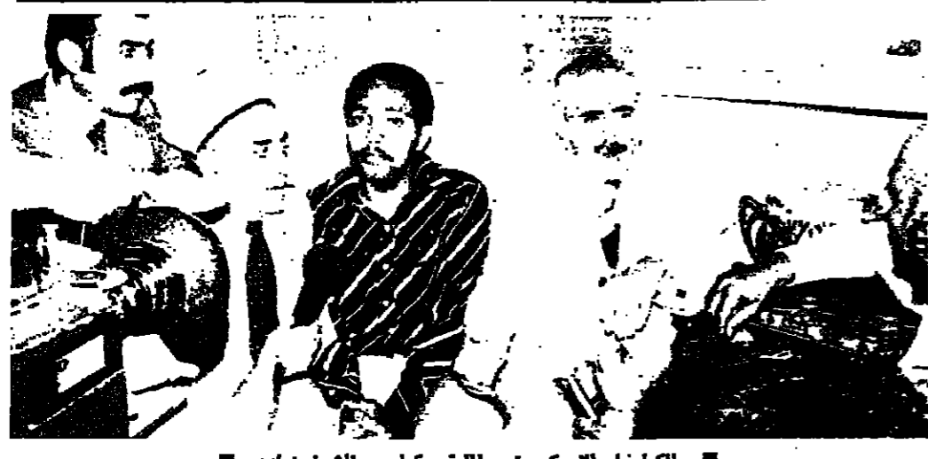
الكولونيل العربي يتوسط الرئيس كرامي والشيخ زيادة

تأجيل يا نصيب يعلن النادي الثقافي الاجتماعي في الحدث عن تأجيل موعد سحب اليانصيب الخيري على سيارة فيات ١٢٧ الى الثاني من تشرين الثاني ١٩٧٥ وذلك بسبب الاحداث الاخيرة .